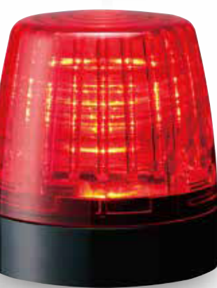
Modelo de un sólo color (rojo)