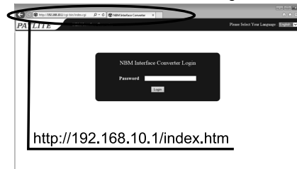
Figura 1 Pantalla de inicio de sesión